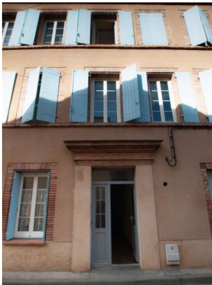
sud * ag3-immobilier.fr Tarn nord Tarn sud * ag3