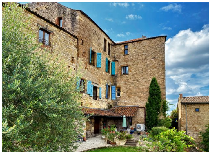
mmobilier.fr Tarn nord Tarn sud * ag3-immobilier.fr Tarn nord Tarn sud * ag3-immobilier.fr Tarn nord Tan