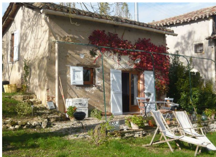
mmobilier.fr Tarn nord Tarn sud * ag3-immobilier.fr Tarn nord Tarn sud * ag3-immobilier.fr Tarn nord Tan